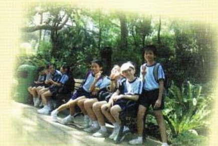
樹蔭下排排坐，開心快樂笑呵呵。