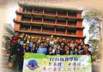
大伙兒於廣州鎮海樓前合照。