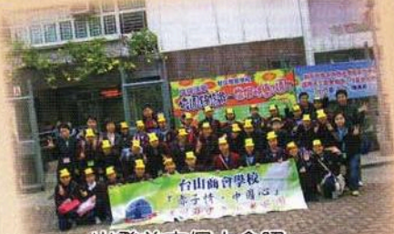
出發前來個大合照。