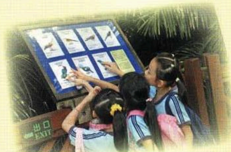
係呢隻啦！你睇佢地嘅羽毛幾靚！