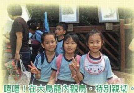
嘻嘻！在大鳥籠內觀鳥，特別親切。

本年度秋季旅行分高低年級兩組進行，1至4年級到香港公園，而5及6年級則到動植物公園參觀遊玩。兩處地方各具特色，同學們都能盡興而回。