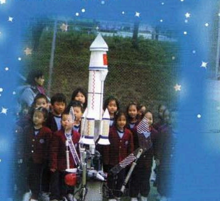
這就是陳易希校友在神舟六號航天員訪港時，為歡迎費俊龍及聶海勝兩位航天員而設計的電腦水火箭！