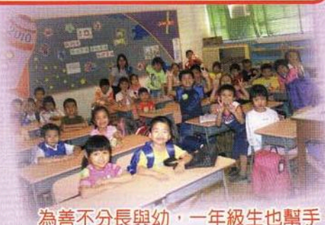
為善不分長與幼，一年級生也幫手。