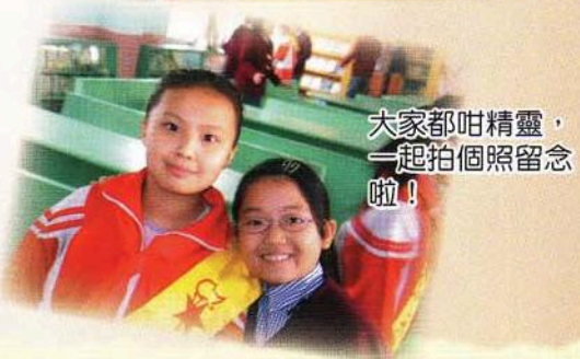
大家都咁精靈，一起拍個照留念啦！