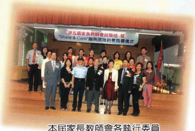
本屆家長教師會各執行委員和三位主禮嘉賓合照。