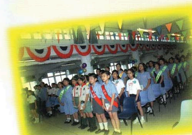
各服務團隊成員在儀式進行期間，整齊肅立地宣誓！