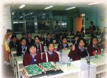
本校學生於廣州大江苑小學上課，體驗中港兩地不同的教學方式。