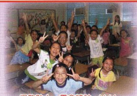
捐款助人，零舍精神，Yeh!