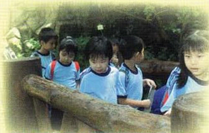
嘩！好高啊！有點兒腳震添。