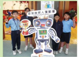
參加「香港機械人運動會」，與全港精英交流創作心得。