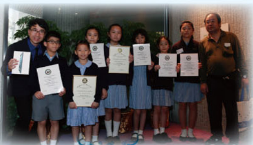
得獎學生和老師合照