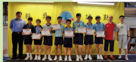
本年度取得3冠4亞3季佳績