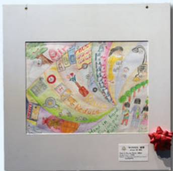
低年級冠軍作品 2A 羅穎凝