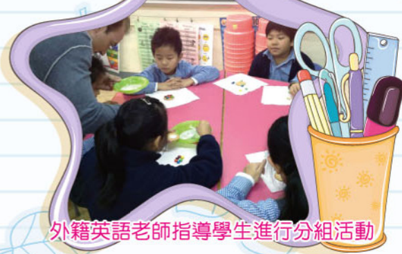
外籍英語老師指導學生進行分組活動