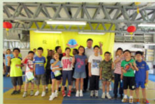
校長和同學的合照

一年一度的公益金便服日，同學們既可參與籌款活動，又可穿著便服回校上課，真是一舉兩得。因此當天每位同學臉上都帶着愉快的笑容，令本來充滿歡樂的校園生活，更添上繽紛的色彩。