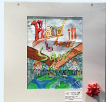
高年級冠軍作品 6A 李嘉燕