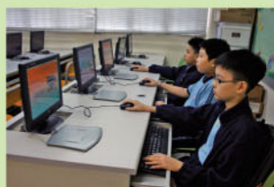
同學們正聚精會神地聆聽導師的指導設計他們參賽的簡報

每年校方都會從電腦精英班挑選表現傑出的同學參加由香港電腦教育學會舉辦的資訊科技挑戰獎計劃金章校外評審，透過以上的評審，學生除了能學會製作簡報外，還可培養他們向人們演說的能力，提升個人自信。而每年參加此活動的學生都獲金、銀、銅及證書。