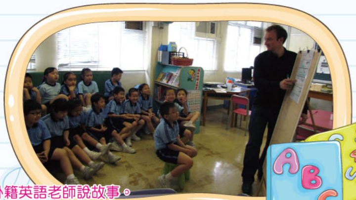
外籍英語老師說故事。