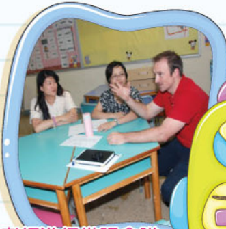
英文老師進行備課會議