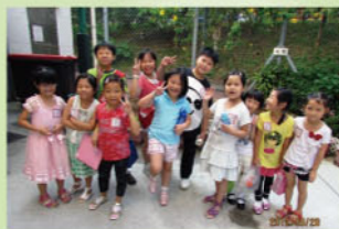
同學們穿上便服開心地上課。