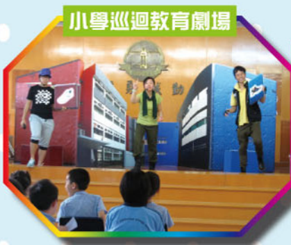
小學巡迴教育劇場