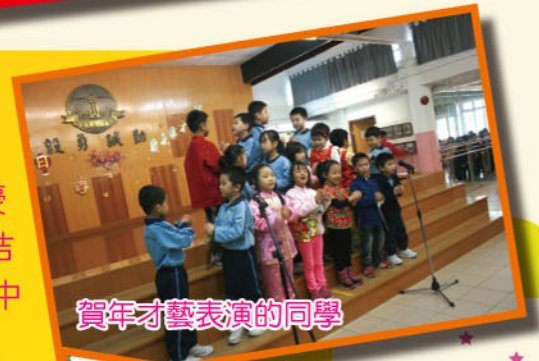
賀年才藝表演的同學

二零一三年二月七日（星期四），本校舉辦中國文化日活動，讓學生們認識及欣賞中國文化。當日節目豐富，有賀年才藝表演、賀年飾物製作、賀年動畫和攤位遊戲。