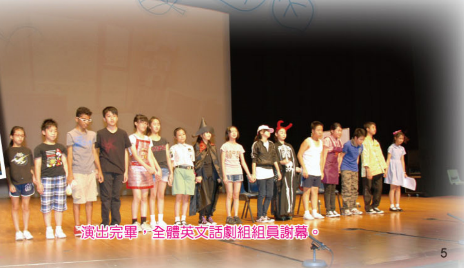
演出完畢，全體英文話劇組組員謝幕。