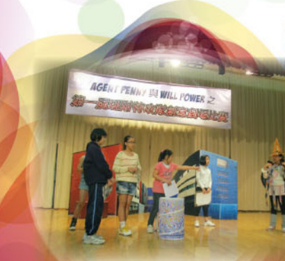
第一屆「Agent Penny與Will Power之理財特攻創意戲劇比賽優異獎」