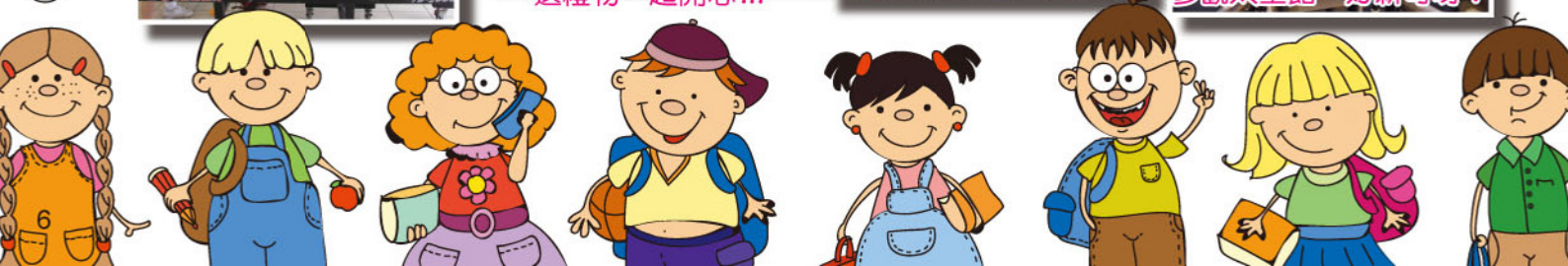
參觀太空館，好新奇呀!