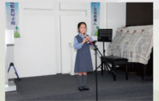
探訪恩福老人中心表演吹奏牧童笛

同學們的努力，大家是有目共睹。除了參加全港校際音樂節比賽外，還參與家教會舉辦的老人院探訪。同學開心地吹奏牧童笛，為老人院帶來歡樂。