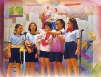
故事劇場初賽《謝謝你·生命》