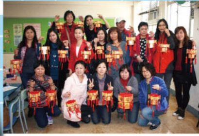
家長興趣班：宮燈製作