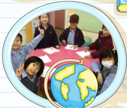
依外籍英語老師指示完成課業。