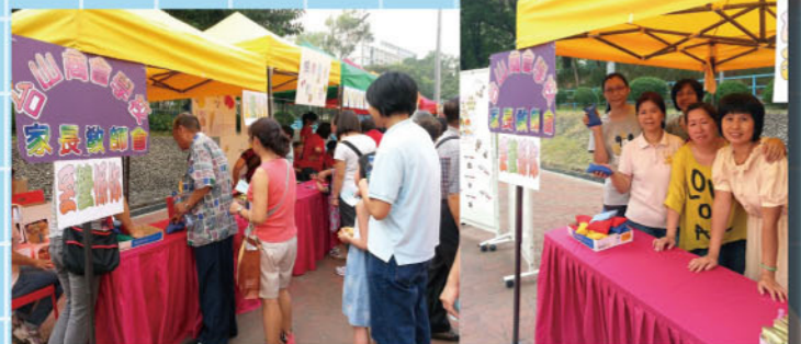
關懷長者全接觸嘉年華