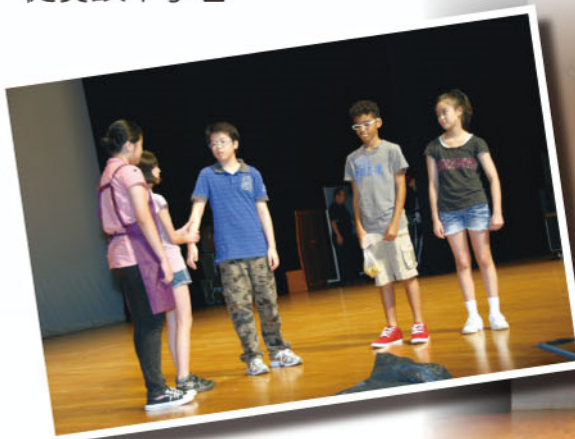
英文話劇組在畢業禮的演出

本校英文話劇組成立已五年，成員來自全校各級，每年都會在畢業禮演出，作為階段學習成果的展示。本年度演出的劇目是《金幣》—Gold Coins，無論劇本的改編、戲劇的排練、道具的製作、音響錄製等，均由本校英語老師及話劇組同學負責，充分體驗團隊精神，使學生能從實踐中學習。