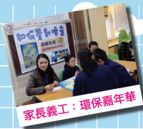
家長義工：環保嘉年華

本校家長教師會已成立十六年，每年均舉辦多項親子活動及家長興趣班等。家長義工又常協助本校進行各項活動，加強教師與家長的溝通，發揮家校合作的精神。