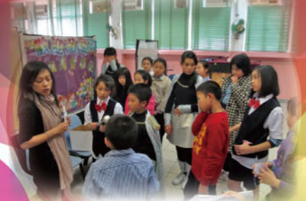
學校戲劇節：傑出合作獎