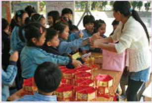
家長義工鼎力支持

本校師生一直都關心社會、關愛他人，因此每年由屯門區公益少年團舉辦的慈善年花義賣，本校的師生及家長都踴躍支持及參與，為善不甘後人，今年所籌得的款項更奪得慈善年花義賣的亞軍，成績斐然。