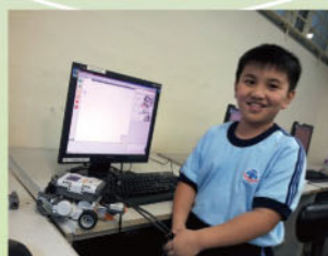
學習組裝機械人及編寫程式。