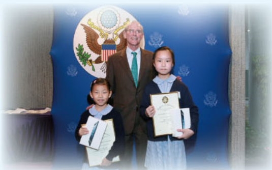
兩位冠軍與美國駐港領事合照