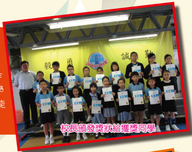
校長頒發獎狀給獲獎同學

老師在課堂上，採用多元化的教學活動。包括普通話朗讀課文、拼音練習和遊戲、觀看動畫和寫作活動等。透過這些活動，由淺入深，讓學生掌握並提高運用普通話進行口語的表達的能力。