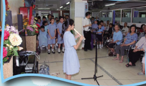
親子義工探訪(寶興安老院)