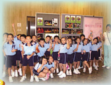
觀賞偶友街作《烏拉森林》互動人偶音樂劇