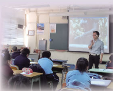
能說善道計劃，提升學生寫作技巧。