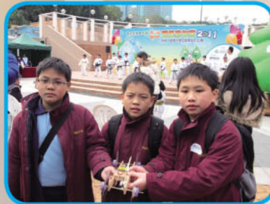
「第十屆環保創意模型設計比賽·老鼠夾模型車比賽」