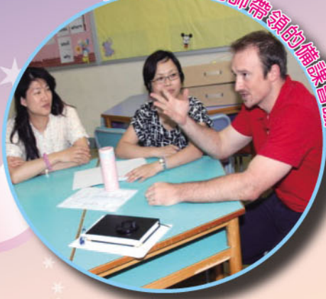
由外籍英語老師帶領的備課會議