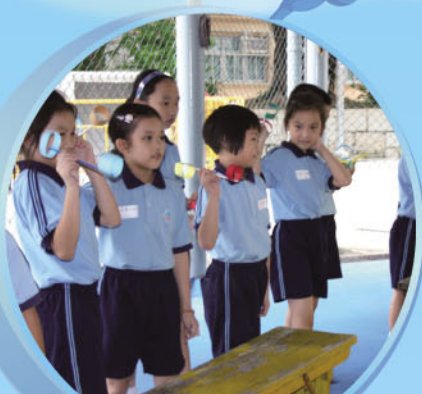
三年級：飲管飛行器