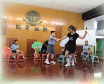
「能說善道」校內演出一神筆馬良。