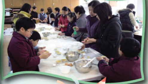
親子美食班(親子蛋撻)