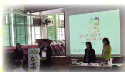
2) 窮小子富小子講座