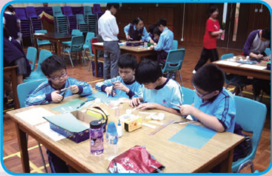
永隆中學環保科學創意邀請賽