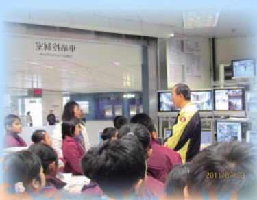
1) 參觀港鐵--屯門西鐵站