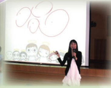
繪本作家天使媛媛講座。