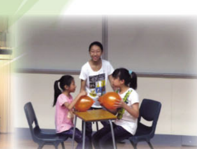
香港創意戲劇節2011 匯演獲優異獎。