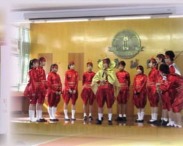
李琳明中學師生到校進行創意思維及多元思考互動劇場《蟻民》活動。