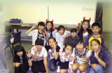
愛無毒戲劇比賽獲參與獎及最佳演員獎。