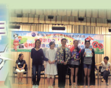
「禁毒·滅罪」屯門區健康校園話劇及口號創作比賽獲季軍。