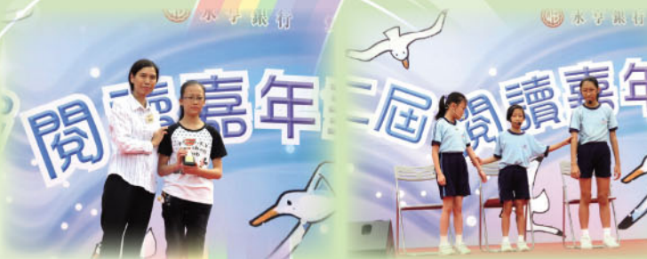
閱讀嘉年華故事劇場比賽，以書叢榜圖書《唐家小豆事》及《我們這一班》參加比賽，兩組均獲得優異獎。