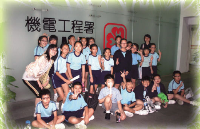
服務團隊之一：環保小天使