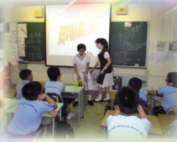
聖西門呂明才中學到校進行伴讀特工隊跨校交流計劃。