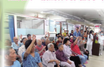
在老人院演出神筆馬良以供長者欣賞。