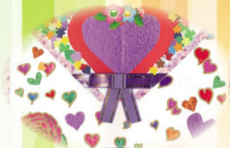
親子心意卡設計比賽