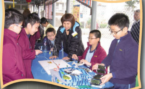
中國文化日家長義工服務