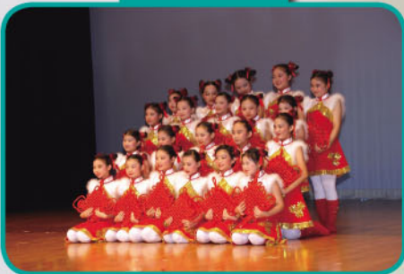
二零一一年屯門區第二十五屆舞蹈比賽銀獎