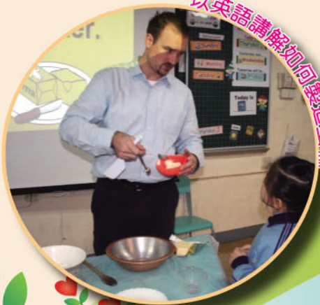
以英語講解如何製作蛋糕