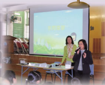
會計師公會派出專業會計師主持窮小子富小子【聽故事·學理財】活動。