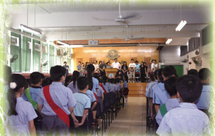
服務團隊進行宣誓

學生在參與不同的服務團隊時，都表現積極、主動。看他們宣誓時一臉嚴肅，就知道學生對自己的職責多麼重視；學生團隊在訓練活動時投入參與，小組通力合作克服老師交予的一個個難關；校方也會為各團隊安排不同的活動和服務，全年進行，培育關愛和服務的良好品格。