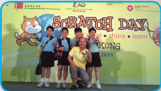
「Scratch Day 2011」刷新「最多人參與的數碼遊戲設計活動」健力士世界紀錄