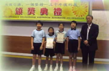
全港中小幼學生生命教育創意解難劇本創作(第一屆)比賽獲兩個傑出獎。