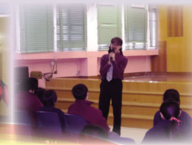
人仔叔叔教同學講故事。