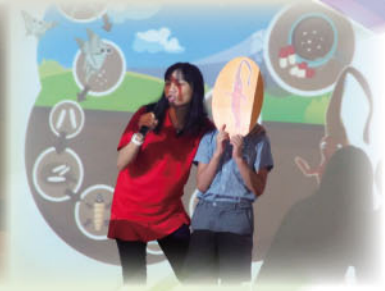
「中藥保健知多少」講座讓學生了解有關中藥的知識。