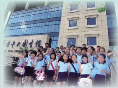
參觀香港中央圖書館