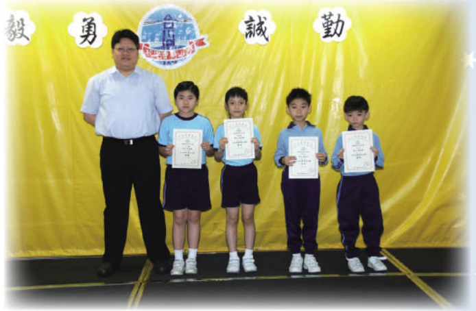
中文硬筆書法比賽頒獎