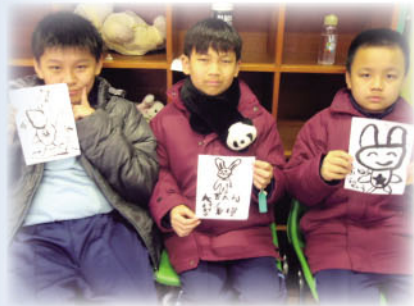
中國文化日(愉快中學習)

舉辦中文週，不但能吸引同學參加中文活動，也能擴闊同學視野。讓同學在課餘，有更多時間接觸中文，從而增加對中文的興趣。