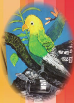
花鳥蟲魚環保板畫 繪畫比賽