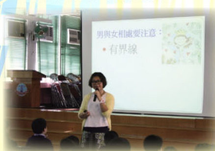
1) 男男女女健康教育講座