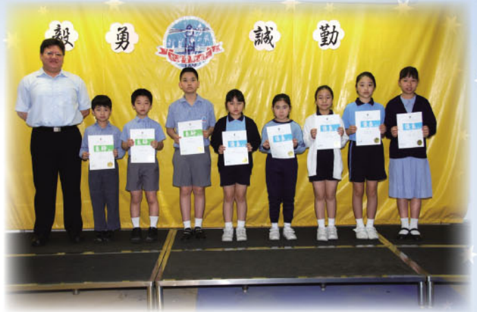
參加六十二屆朗誦節獲獎的同學

各中文科老師每年都會檢討，如何可以提升中文科教學技巧，以及診斷學生普通話能力和幫助學生提升語文能力的方法。