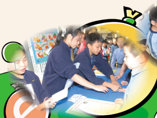
攤位遊戲—同學們玩得很投入

本年4月19日至4月23日，是一年一度的英文週。舉辦英文週之目的，是為學生提供一些有趣的英文活動，以增強學生學習及使用英文的動機。在英文週內，每天都有一項活動，例如英文寫作比賽及英文故事時間等。4月23日的「英語同樂日」，是英文週的高潮，當天全校師生都參加了各項活動，同學們更獲得不少獎品，可說滿載而歸。