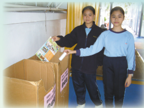
她們手上的廢紙才可以回收再造的。