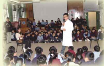
禁毒講座：無毒真人蘇