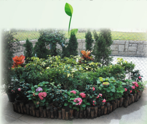
本校正門旁的花壇，新加入了藍色和粉紅色的繡球花、茶花。