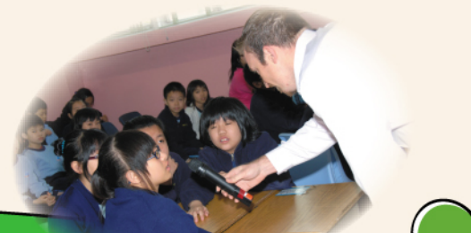
英文問答遊戲—難不倒聰明的同學