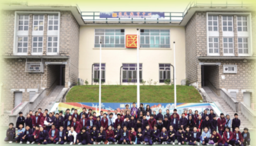
參觀國民教育中心