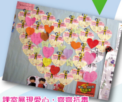
課室展現愛心，齊齊抗毒

10月2日 我向不良朋輩說「不」：讓學生體驗潔身自愛的重要性，並理性地處理朋輩壓力，堅持自己的原則，學習運用策略抗拒不良朋輩的壓力和藥物誘惑。