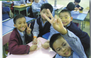
哇！我們砌到喇！學生成功解難非常開心

1月20日 如何面對逆境：透過解難遊戲、觀看力克短片，學習ABC理論，培養學生以正面積極的態度去面對困難。