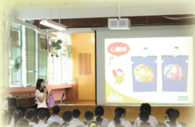
禁煙講座：無煙新世代