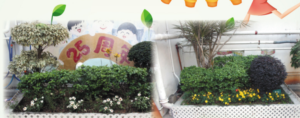
本校有蓋操場旁花園種有波斯菊、雛菊、秋英和大黃花。