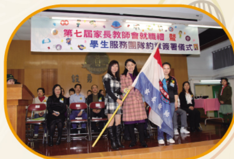
12月11日 家長教師會就職典禮