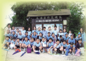
參觀米埔：濕地小偵探