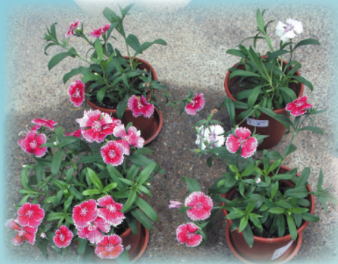
你看石竹花多美麗！

本年度「環保雙周」舉辦了多個不同類型的活動。首先，是「一人一花獻愛心」種植活動，今年的主題花卉是石竹。