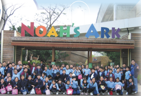
挪亞方舟參觀_關愛遊戲課