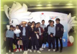
參觀東亞運動會比賽