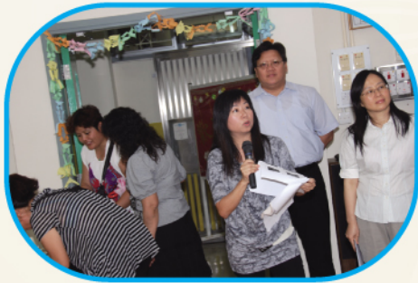
9月25日 家長教師會會員大會