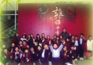
參觀香港歷史博物館