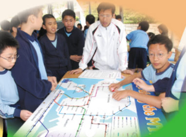
攤位遊戲—師生同樂