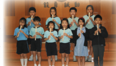
牧童笛訓練班上課的情況