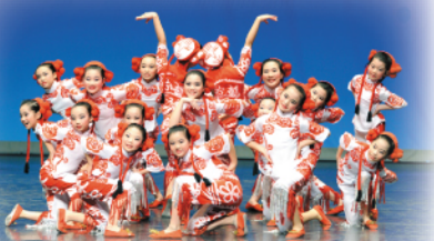
舞蹈【雙面娃娃】造型照

多年來，東方舞蹈組曾參與多項表演及比賽，表現優良。本學年，東方舞蹈組除了參與校內表演外，還分別於第四十六屆校際舞蹈節比賽及第二十四屆屯門區舞蹈比賽中，取得甲級獎及銀獎。學生透過參與舞蹈表演及比賽，學會了團隊精神，並提升了自信心。