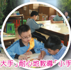
「大手」耐心地教導「小手」