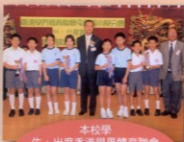
本校學 生，出席香港學界體育聯合 會主辦的球類頒獎 典禮，領取多項獎項。