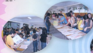
公眾人士對學生的作品，深感興趣。

本校於6月22日參加了由教統局主辦的語文教學分享會——「有效的中文課程學與教」，向公眾展示本校與教統局合作的課程發展成果，是次活動共有11間中小學參加，本校獲邀參加，深感榮幸。