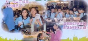
這個設計很美麗，影低記錄咗走羅。