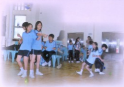
團結就是力量，同學們手牽手進行遊戲。

為培養風紀隊的同學的自信心、合作及團結精神，學校於5月28日在烏溪沙舉辦風紀歷奇訓練營。