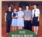
本校 舞蹈組在舞蹈節 中分別獲得甲級獎及 金、銀獎。