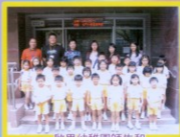
啟思幼稚園師生和本校教職員合照。