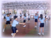
同學們的雙腳像裝上彈簧一樣，一瞬間已完成數十下動作。