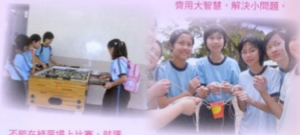
實用大智慧，解決小問題。