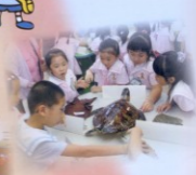
啟思幼稚園學生參觀本校新設的環保資源室，對各種標本很感興趣。