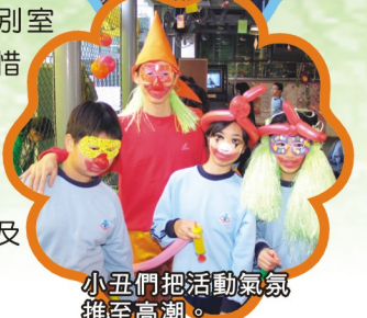
小丑們把活動氣氛推至高潮。