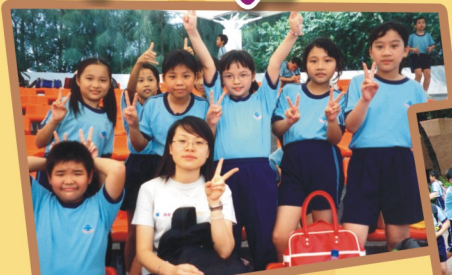
公園景點多，大家齊來參觀。

同學們分別開心地到九龍公園、大埔海濱公園旅行。在老師帶領下，他們參觀了中國式花園、鳥湖、雕塑徑和百鳥苑、回歸塔等。在大自然的環境下，師生樂也融融。此外，同學們更在衛生教育展覽及資料中心上了一課寶貴的常識課。