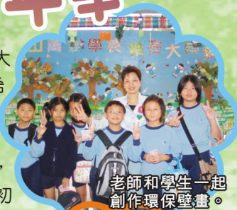
老師和學生一起創作環保壁畫。