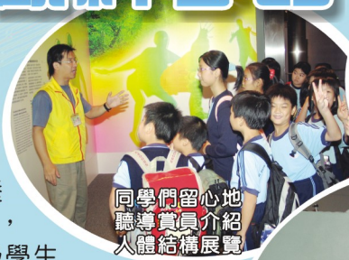
同學們留心地聽導賞員介紹人體結構展覽

為使學生能從全方位學習，本校不斷為學生提供課堂以外的學習機會，讓學生能從親身觀察及驗證下，完成個人學習經歷，使學習成果更深刻，培養他們探究式的學習精神。為此，本校於十月十五日，安排五年級學生到香港科學館參觀趣味科學示範展覽，當天活動內容豐富，同學們對各種科學示範及展覽物品都表現得很感興趣，不斷向在場工作人員及老師發問，充分表現出他們好學的特質。