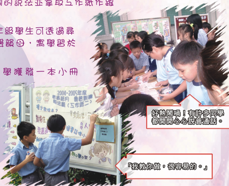
好熱鬧喎！有許多同學都開開心心說普通話。