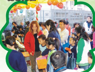
家長及學生一起參加攤位遊戲，樂也融融。