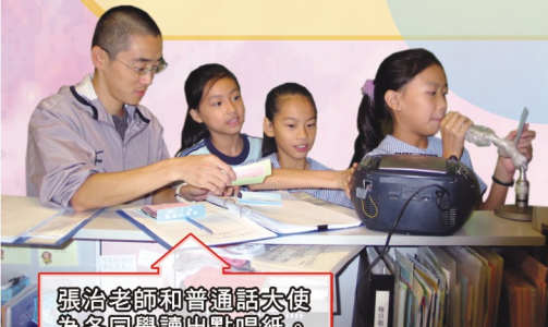
張治老師和普通話大使為各同學讀出點唱紙。