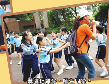
麻鷹捉雞仔，師生同樂。