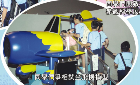
同學們爭相試坐飛機模型