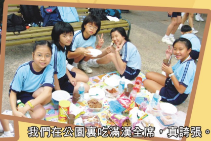
我們在公園裏吃滿漢全席，真誇張。