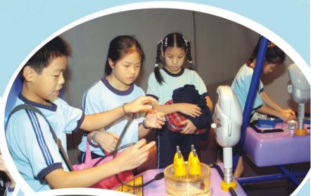
同學們興致勃勃地參觀科學展覽廳