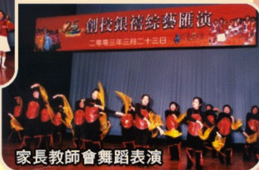
家長教師會舞蹈表演